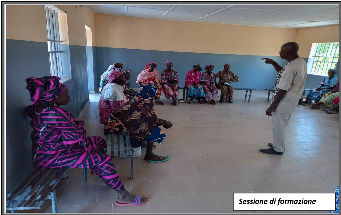
Sessione di formazione